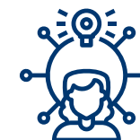
Participativno podučavanje i učenje (PTL)