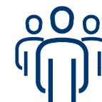
Učenje po modelu