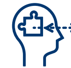
Strategije vizualnog razmišljanja (VTS)